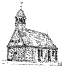
Kirche Alt Wallmoden

Mail: leiter@ejwau.de Webseite: www.ejwau.de