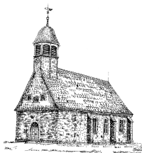
Kirche Alt Wallmoden

Mail: leiter@ejwau.de Webseite: www.ejwau.de